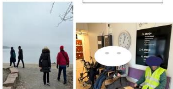
Oppoverbakke må til også i dag.