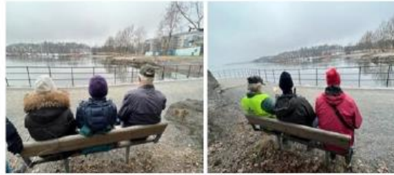
Drikkepause lang Sollerudstranden.