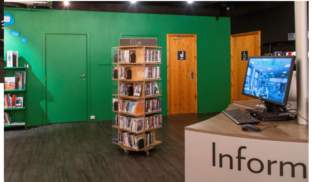
Nach der Umgestaltung