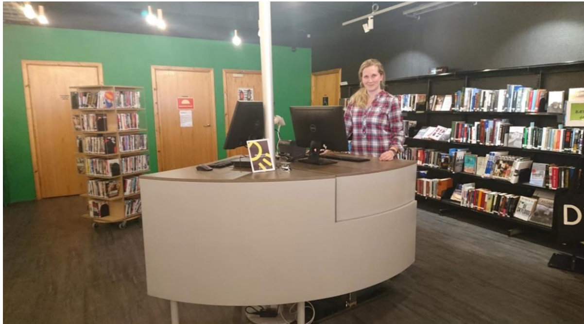
Vor der Umgestaltung