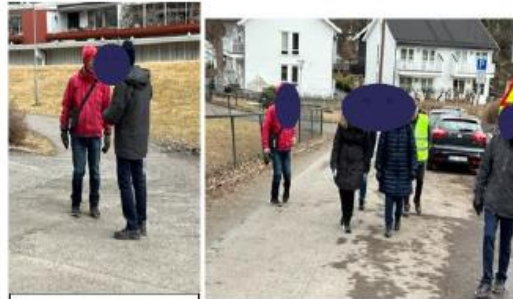
Tro hva disse herrnene snakker om?